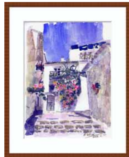
安樂秀典会員作品